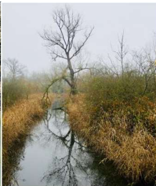
Exemple de branche à couper pour éviter sa chute dans le lit

Ce type de travaux ne nécessite pas d'autorisation ou de demande particulière. Il est cependant proscrit de dessoucher les arbres, d'utiliser des produits phytosanitaires d'enlever ou de détruire des œufs ou des nids. Il est fortement déconseillé d'intervenir sur la période printemps/été (contacter la CCCE pour plus de précision).