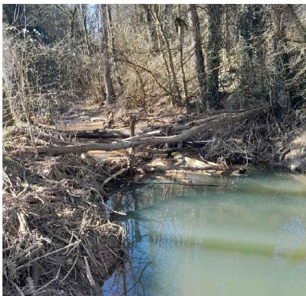
Exemple d'embâcle à retirer